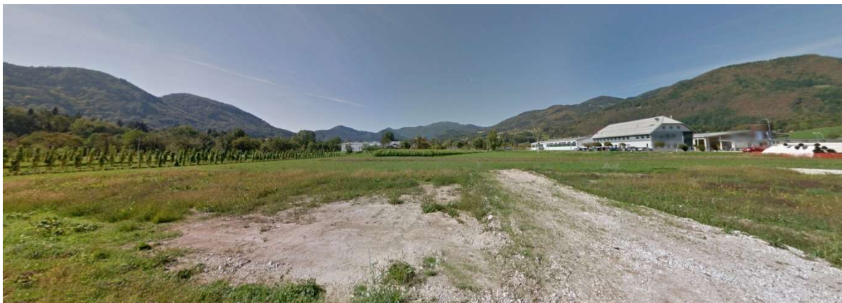
Slika 7: Pogled na območje z vzhodne strani