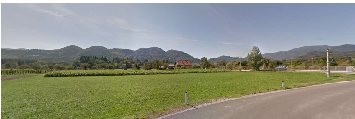
Slika 6: Pogled na območje z severne strani

Preko jugozahodnega dela območja poteka visokonapetostni nadzemni električni vod. Na zahodnem in vzhodnem robu pa poteka elektronsko komunikacijsko omrežje.